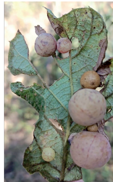
FIGURA 4. AGALLAS en tejido foliar de un encino

Las avispas inductoras de agallas de la familia Cynipidae son un grupo de insectos que tienen una relación muy estrecha con los encinos. La familia contiene aproximadamente 1400 especies, las cuales se encuentran distribuidas principalmente en las zonas templadas del hemisferio norte. Esta familia está representada por avispas inductoras de agallas en diversas especies de plantas. Sin embargo, la tribu Cynipini destaca por su estrecha relación con los encinos, ya que el 70% de sus especies inducen la formación de agallas en este grupo de plantas hospederas. Para México se han descrito alrededor de 180 especies de cinípidos, las cuales están estrechamente relacionados a 30 especies de encinos. Los cinípidos son avispas de tamaño muy pequeño que miden de 1 a 7 mm, son de colores mates y sombríos, y presentan un abdomen comprimido lateralmente (Fig. 3). Estos organismos causan deformaciones en las ramas u hojas de sus encinos hospederos, ya que se alimentan del tejido mesófilo formando las agallas (Fig. 4).