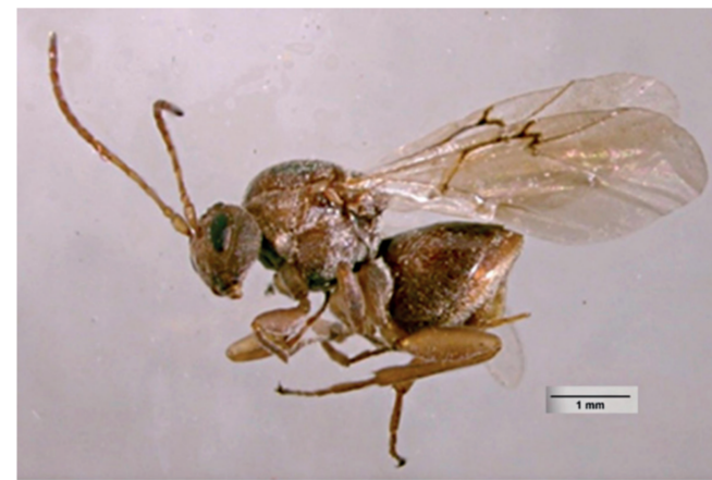
FIGURA 3. AVISPA inductora de agalla en encinos

Agallas y sus avispas inductoras: pequeños mundos dentro de un árbol