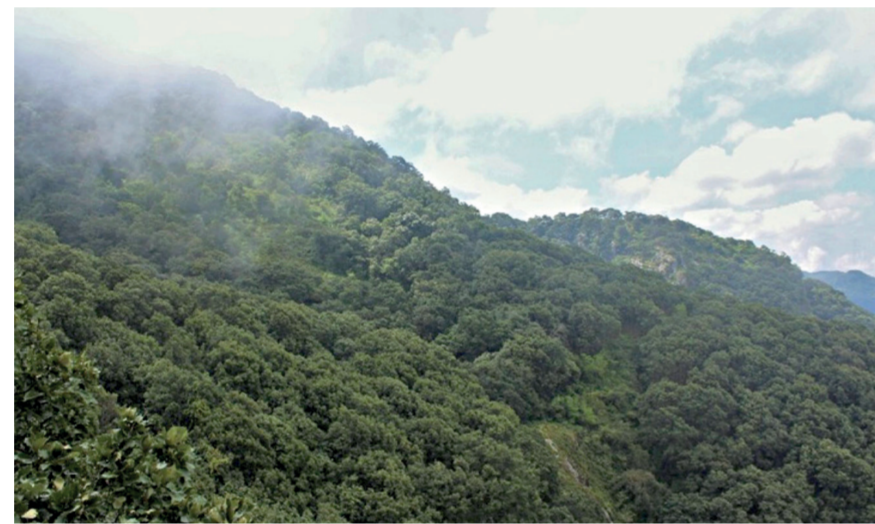
FIGURA 2. BOSQUE de encino en el Estado de Morelos

Estos árboles son auténticos pilares de los bosques (Fig. 1B). Participan en la formación del suelo, ayudan a captar agua y a recargar los mantos acuíferos y también son hogar de una rica diversidad de especies, al establecer interacciones con hongos, plantas epífitas, aves, mamíferos y una gran cantidad de insectos. Además, tienen un importante valor económico: su madera es de gran calidad y se utiliza para diversos fines (incluyendo su uso como combustible en comunidades rurales), mientras que su corteza, hojas y frutos son aprovechados como recursos medicinales y alimenticios. Recientemente se ha propuesto que algunas especies de encinos tienen atributos de especie fundadora, ya que en los bosques en donde habitan crean las condiciones y recursos necesarios para el establecimiento, sobrevivencia y reproducción de otras especies. Es decir, se ha documentado que diferentes especies de plantas, animales, hongos y líquenes dependen de las plantas de encino de manera di-