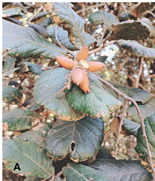
FIGURA 1. A) Bellotas del encino Quercus rugosa, B) árbol de encino

Recuerdo las caminatas matutinas a través del bosque con mi papá y mi hermana hacia la casa de mis abuelos, cuando éramos pequeños, rodeados por árboles inmensos y frondosos: encinos. La paz y la tranquilidad que me transmitían esos momentos mezclados con el crujir de las hojas al caminar fueron el comienzo de mi historia de amor con estos magníficos árboles que son parte de las maravillas de nuestro país y que podemos encontrar en el estado de Morelos. De camino a la Ciudad de México, ya sea por la carretera libre o por la autopista, seguramente te has percatado de la presencia de varias zonas boscosas y quizá en alguna ocasión te hayas preguntado: ¿a qué especies vegetales pertenecen los árboles que habitan en esos bosques? Uno de los grupos más importantes en esas zonas boscosas es conocido comúnmente como encinos, y los biólogos los llaman Quercus. Dentro de este grupo vegetal hay especies de árboles y arbustos que se reconocen por sus semillas, también conocidas como bellotas. Quizá esta información no te diga mucho, pero seguramente recuerdas el tesoro que incansablemente buscaba conseguir Scrat, la ardilla con dientes de sable de la película animada "La Era de Hielo". Ese tesoro es una bellota de encino (Fig. 1A). Y es verdad que los encinos son un verdadero tesoro, pues desempeñan un papel fundamental en los ecosistemas templados del hemisferio norte.