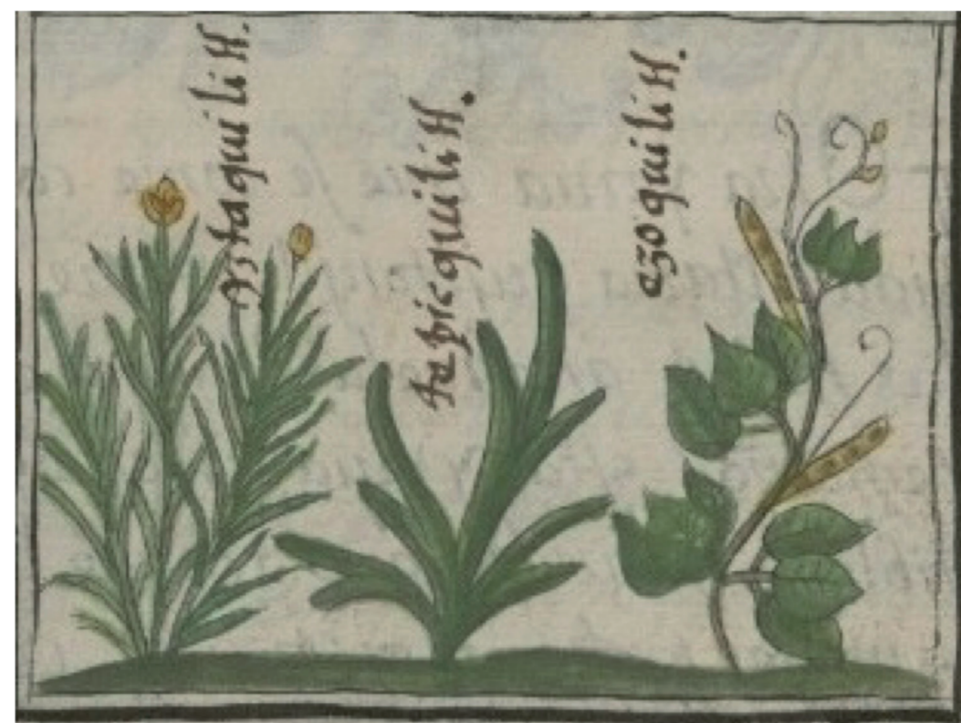
FIGURA 2. ILUSTRACIÓN de diversos quelites, incluyendo el romerito (izquierda, iztaquilitl ) en el Códice Florentino.

A la llegada de los españoles a México, el consumo de quelites en la alimentación era abundante en Tenochtitlan. Fray Bernardino de Sahagún, en su obra Historia General de las cosas de la Nueva España (también conocida como Códice Florentino ) da muchos ejemplos de los diferentes quelites consumidos, incluyendo el romerito. Lo describe como una planta “baja y de poca copa. Tiene sabor de sal. Cómese cocida y cruda”. Junto con otros quelites, nos da uno de los primeros dibujos de su apariencia (Figura 2). Francisco Hernández se refiere también al romerito como “Tiene las raíces fibrosas, de donde los tallos brotan con hojas delgadas y larguillas, llevando en