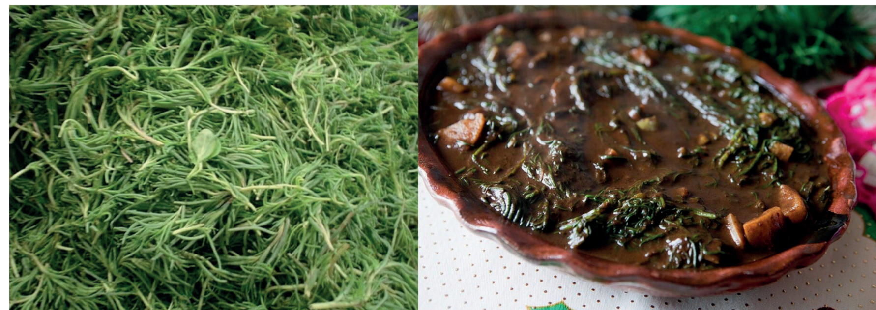
FIGURA 1. LOS romeritos, en fresco (izquierda) y en mole (derecha).

pales y, tal vez por aversión al consumo de insectos, se substituyó al ahuate por camarón. Con esto, el plato estaba listo para consumirse en festividades religiosas en donde se limita el consumo de carne, como en la semana santa y en la navidad.