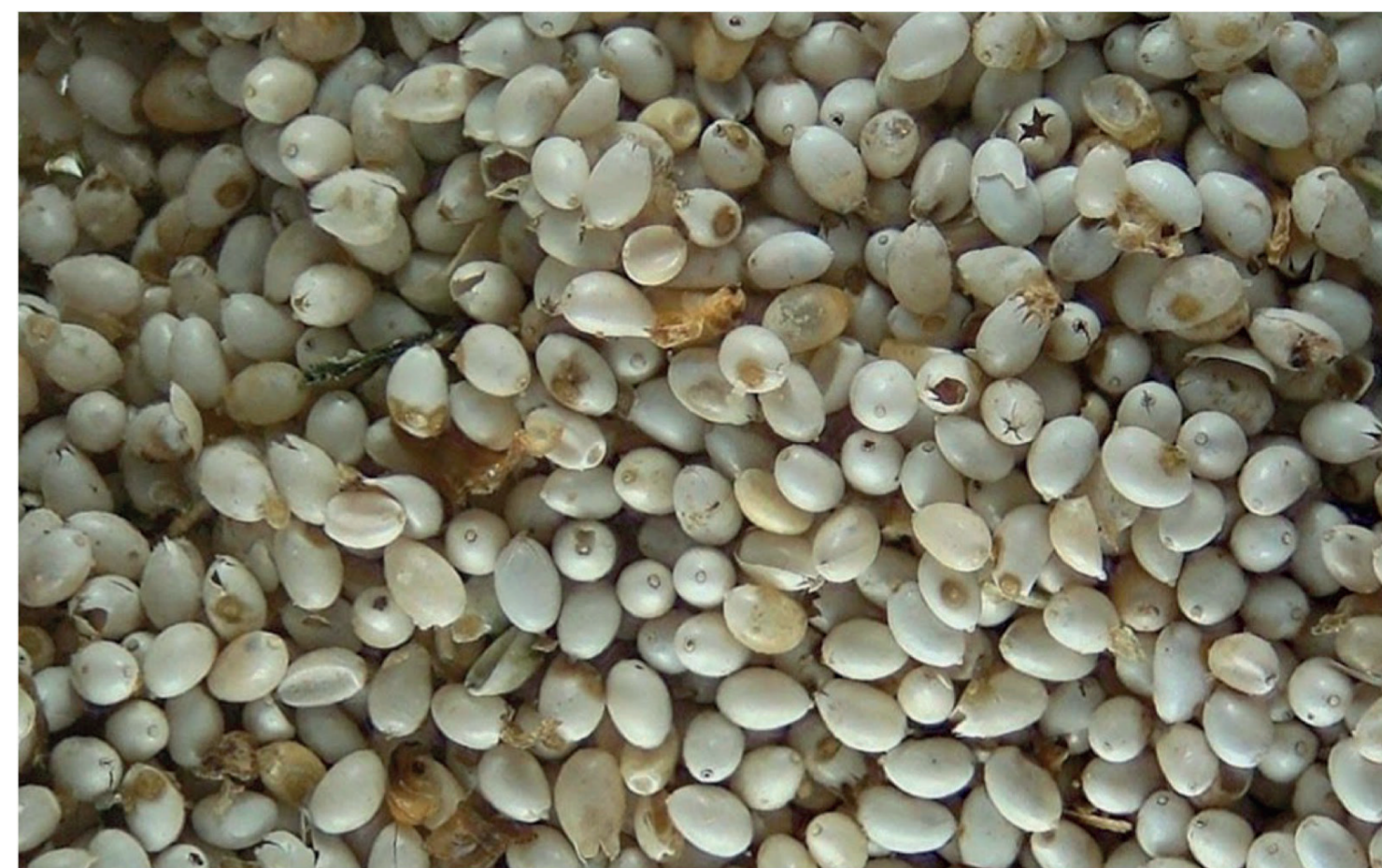
FIGURA 3. EL ahuautle, la huela de una chinche de agua llamada axayácatl .

Los mecanismos por los cuales el romerito puede crecer bien en altas concentraciones de sal aún se están estudiando. Pero hay tres características de esta planta que parecen ser las responsables. Una de ellas es que pueden acumular sal en un organelo que existe en muchas plantas, conocido como vacuola (Figura 4). Este organelo, visualizado como un “espacio vacío” en muchos vegetales, es todo menos vacío en plantas como el romerito. En él se acumula eficientemente la sal que podría causar daño a otros procesos celulares. El acumular la sal en ese organelo además permite que la planta de romerito continúe absorbiendo agua.