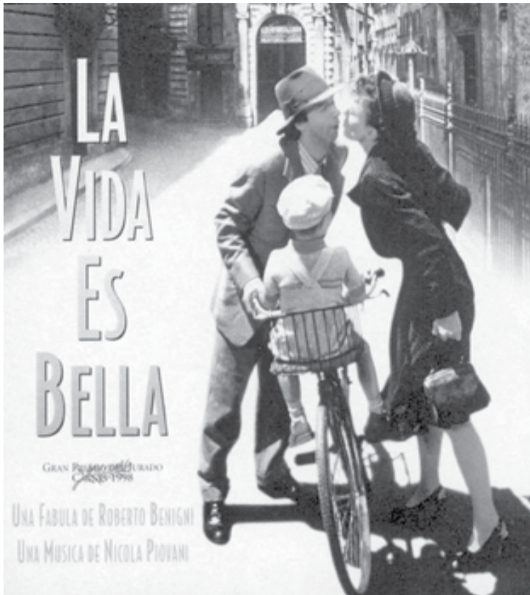
1. Cartel de la película La Vida es Bella .